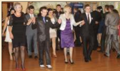
W zabawie uczestniczyli uczniowie i nauczyciele