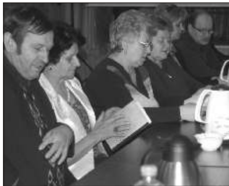
Pasjonaci spotkali się ostatnio w połowie stycznia

Do wspólnego śpiewania zachęca wielu znajomych z Mszany i wkrótce spotkania na