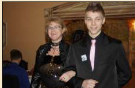
Liceali tego dnia byli wyjątkowo szarmanccy