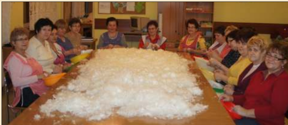
Na szkubaczkach w wietlicy w Gogołowej zebrało si 14 pa . Miały co robi , bo pierza nie brakowało