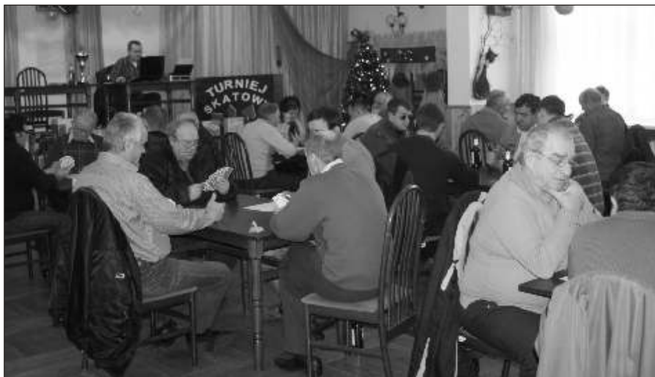
W II Turnieju o Puchar Wójta Gminy Mszana wzięło udział ponad 60 zawodników z całego regionu

Skat to tradycyjna i ska gra w karty, której niełatwe zasady w naszych rodzinach przekazywano sobie z pokolenia na pokolenie. - Gramy tak, jak nauczyli nas nasi dziadkowie. Do dziś skat cieszy się ogromną popularnością. Chcemy podobny turniej