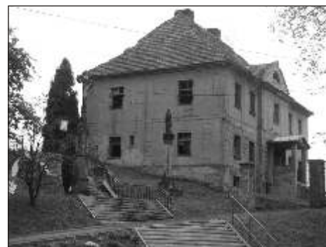
Renowacja centrum Połomi obejmie starą far

projekt kompleksowej modernizacji ulicy Szkolnej w Połomi. (mk)