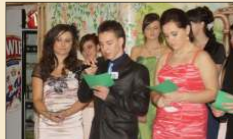
Uczniowie złożyli podziękowania wychowawcom