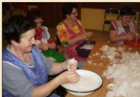
Szkubanie pierza to precyzyjna robota, palce bol

w jej domu i u s siadów urz dzano szkubaczki. - To nie było tylko siedzenie przy misach z pierzem. Na ten czas