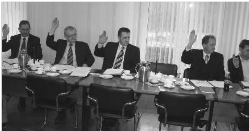
Głosowanie nad przyjęciem uchwały budżetowej na 2012 rok było jednogłośnie

Na rozbudowę i adaptację budynku wielofunkcyjnego w Mszanie przeznaczono w tegorocznym budżecie 2,5 mln złotych. Na renowację centrum Połomi, która będzie realizowana przez dwa kolejne lata zabezpieczono 4,3 mln złotych (na tej inwestycji gmina dostanie jednak 85 proc. dofinansowania z Regionalnego Programu Operacyjnego). - W trudnych czasach mamy budżet nastawiony na inwestycje, ale jeśli chcemy, aby gmina się rozwijała, innej decyzji nie może być - komentuje