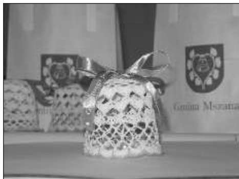
Nasze promocyjne ręcznie szydełkowane dzwonki

W 2011 roku nasza gmina promowana była w wieloraki sposób i w różnych miejscach. Najlepszą promocją były oczywiście imprezy, na czele z Dożynkami Gminnymi, na których wystąpił zespół Łzy, a które odwiedziło wielu mieszkańców nie tylko naszej gminy, ale i miejscowości ościennych.