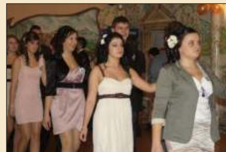
Pierwszym tańcem był staropolski polonez